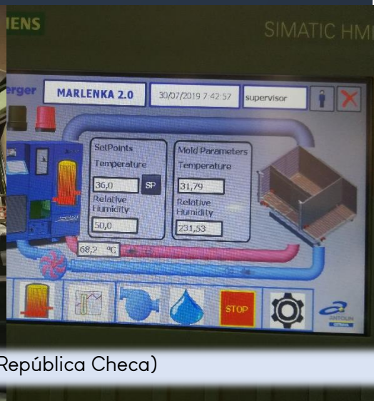
Máquina instalada en Fábrica de Ostrava para Grupo Antolín (Ostrava, República Checa)